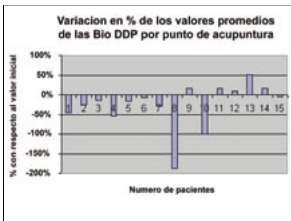
Gráfico 2. Variación de la separación tipo de las Bio-DDP apreciada de acuerdo al cálculo de error con respecto al valor de los campos débiles.

Gráfico 1. Variación del promedio de las Bio-DDP medida por el cálculo de error con respecto al valor de campos débiles.